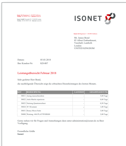
GESTALTBARE BERICHTE Zielgruppengerechte Datenaufbereitung